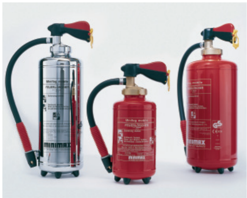
Minifog mobile Feinsprühfeuerlöscher zeichnen sich durch eine hohe Löscheffizienz aus.

Minifog mobile besonders geeignet. Dieser zeichnet sich durch seine hohe Löscheffizienz, nahezu rückstandsfreies Löschen und eine hohe Bedienerfreundlichkeit aus. Dank seiner langen Funktionsdauer können mit ihm auch ungeübte Laien, wie beispielsweise Besucher, gute Löscherfolge erzielen.