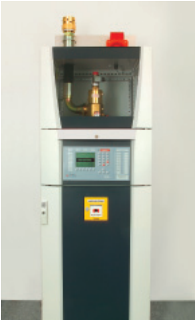
Platz sparend: die MX 1230 Gaslöschanlage