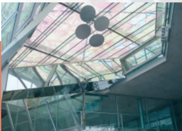
Akademie der Künste, Berlin

Minimax GmbH & Co. KG Industriestraße 10/12 D-23840 Bad Oldesloe Tel.: +49 (0) 45 31 8 03-0 Fax: +49 (0) 45 31 8 03-2 48 E-Mail: info@minimax.de www.minimax.de