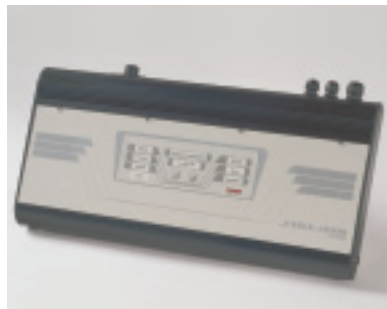
Die Ansaugrohre von Rauchgasmeldern (z.B. Helios) lassen sich oft nahezu unsichtbar installieren.

Brandmeldeanlagen ermöglichen im Brandfall rund um die Uhr das rechtzeitige Einleiten von Gegenmaßnahmen, wie die Alarmierung der Feuerwehr oder die Auslösung einer Löschanlage. Aktive Rauchansaugsysteme gewährleisten